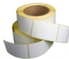
Etiketdrager uit gesiliconeerd papier